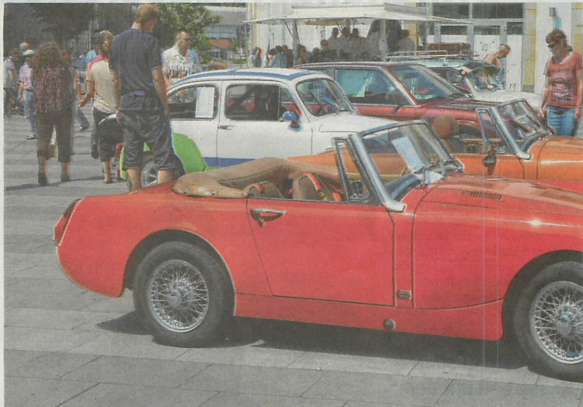
Zum Oldtimer-Treffen findet in Alt-Wetter auch ein verkaufsoffener Sonntag statt. Dazu gibt es viele Stände rund um den Bah

Die Einzelhändler locken an diesem Sonntag mit verschiedenen Aktivitäten zum entspannten Shoppen ein. So können sich die Besucher auf der Kaiserstraße etwa bei einem kostenfreien Segway-Parcours aus-